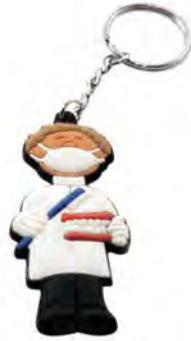
ZP.130.000 Pack of 6 pieces Opak. 6 szt.