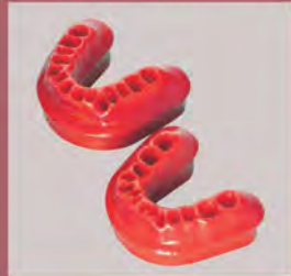
DT.1401.01 Class I Pair / Para Klasa I wg Angle'a DT.1401.02 Class II Division I Pair / Para Klasa II wg Angle'a wersja I DT.1401.03 Class II Division II Pair / Para Klasa II wg Angle'a wersja II DT.1401.04 Class III Pair / Para Klasa III wg Angle'a