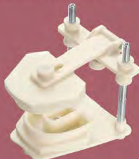
DT.1400.02 Plastic typodont / Typodont plastikowy