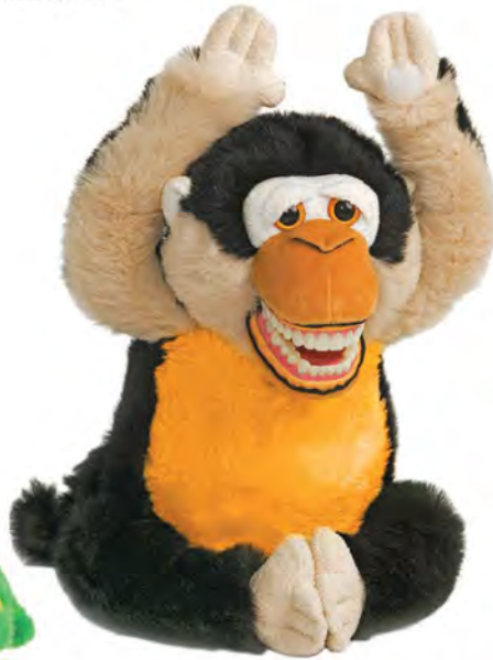
Mojo Monkey SS-PC1000 Aligator