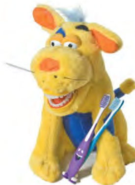
Lil Ollie Z Mutt SO500 Pies