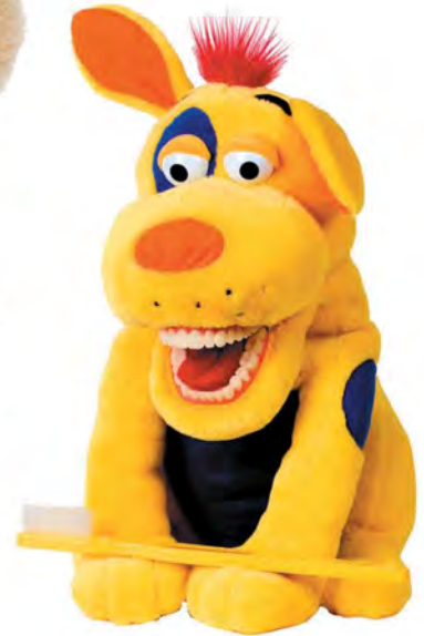
Ollie Z Mutt PD700 Pies