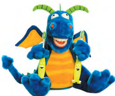
Lil Maqi Dragon PPD300 Smok