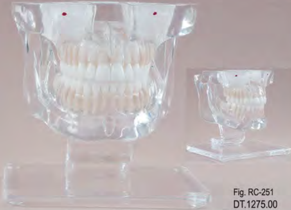
Fig. RC-251 DT.1275.00