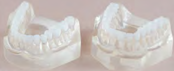
Fig. RV-010 DT.1210.00 Set of 2, upper and lower Zestaw szczęki i żuchwy