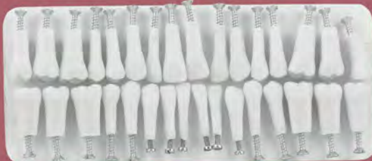
DT.1403.02 Set of 32 teeth with roots / Zestaw 32 zębów z korzeniami

Plastic teeth with screws / Zęby plastikowe bez korzeni ze śrubami