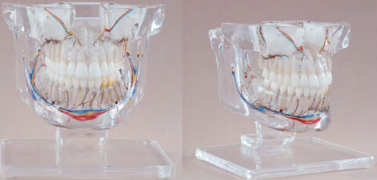
Fig. RC-250 DT.1276.00