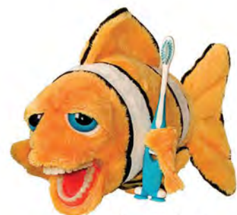
Fin Z Fish PPC200 Ryba