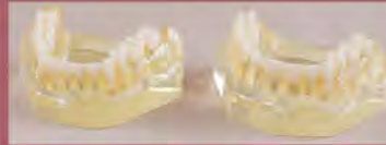
DT.1315.01 Teeth without roots Zęby bez korzeni