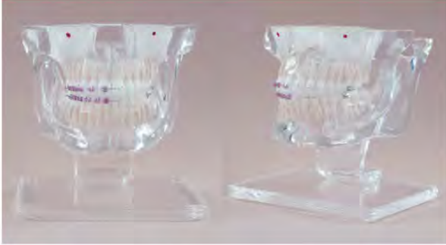
DT.1320.01 With metal brackets / z metalowymi zamkami DT.1320.02 With ceramic and metal brackets / z metalowymi i ceramicznymi zamkami