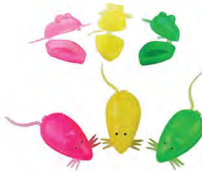
ZP.111.000 Pack of 20 pieces Opak. 20 szt.