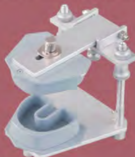
DT.1400.01 Metal typodont / Typodont metalowy

Typodonty są bardzo dobrą pomocą dydaktyczną obrazującą różnego typu wady zgryzu oraz nieprawidłowości w budowie kostnej. Metalowe lub plastikowe zęby umieszczone w bazy woskowej pozwalają na różnorakie ich ustawienie. Przemieszczanie zębów można zademonstrować poprzez ustawienie ich w wybranej bazie woskowej i zanurzenie w gorącej wodzie od 30 do 60 min. w temperaturze 60°C (140°F).