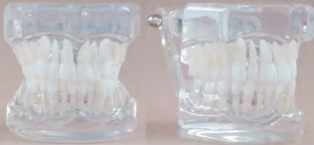
Class I - 'Angle / Klasa I wg Angle'a

DT.1300.01 Two Tones, pink bases / Bazy różowe w dwóch odcieniach