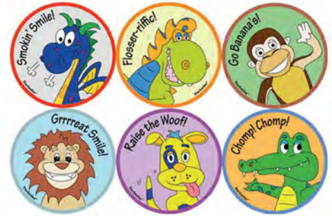
ST-200 Roll of 100 Rolka zawiera 100 szt.