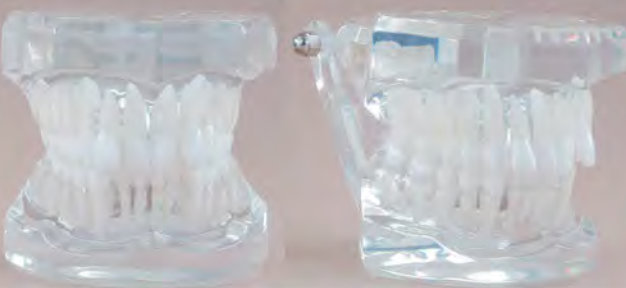
Class II Division II / Klasa II wg Angle'a wersja II