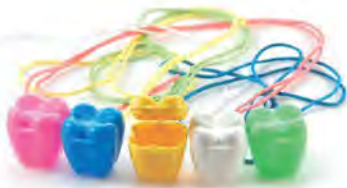
ZP.110.000 Pack of 20 pieces (4 of each color) Opak. 20 szt. (po 4 szt. z każdego koloru)