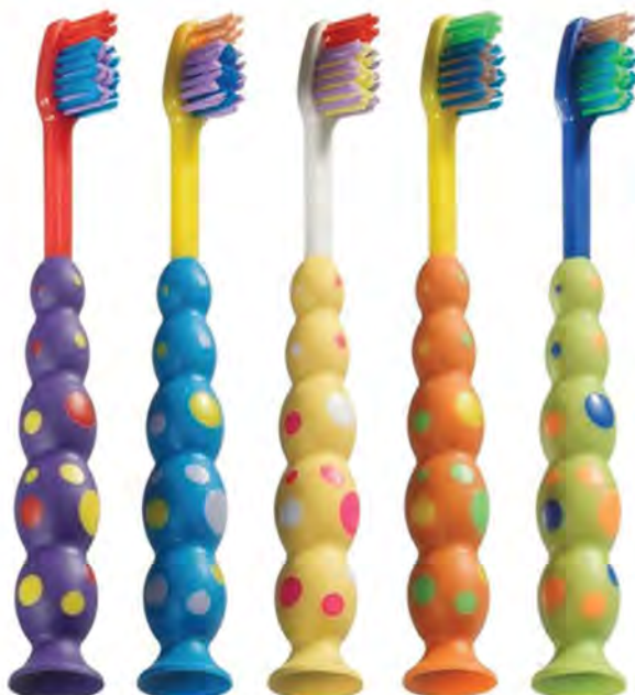
DH.2103.00 Suction cup toothbrush Szczoteczka dla dzieci w kropki