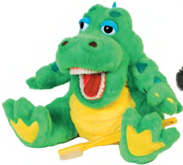
Al E Gator PA400 Aligator

Large - Twice life-size dentition Duże - z uzębieniem 2 razy większym od naturalnych zębów ludzkich Wysokość 40-60 cm Includes 1 large toothbrush Zawierają 1 dużą szczotkę do zębów