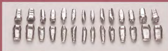
DT.1403.01 Set of 28 teeth without roots / Zestaw 28 zębów bez korzeni