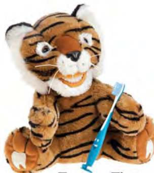
Tango Tiger ST500 Tygrys