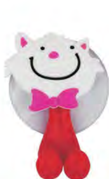
ZP.150.001 Kitty / Kotek