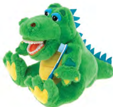
Allie Gator PPA200 Krokodyl