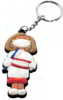
ZP.130.001 Pack of 6 pieces Opak. 6 szt.