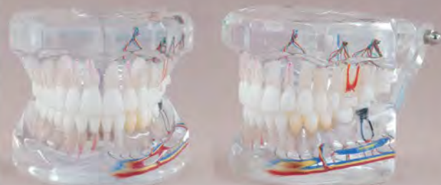
Fig. RE-111 DT.1251.00