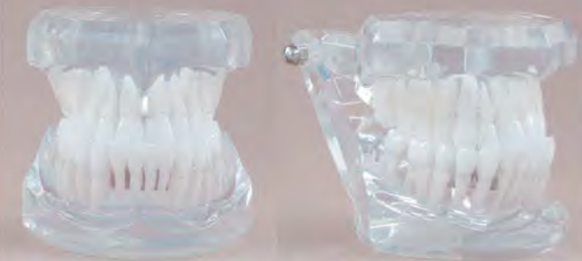
Class III / Klasa III wg Angle'a