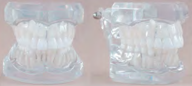
Class II Division I / Klasa II wg Angle'a wersja I