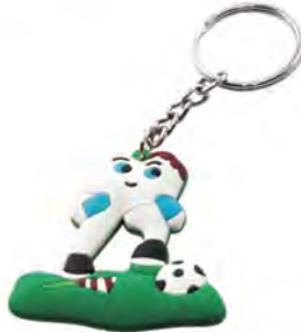
ZP.131.000 Pack of 6 pieces Opak. 6 szt.