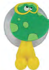
ZP.150.003 Frog / Żaba