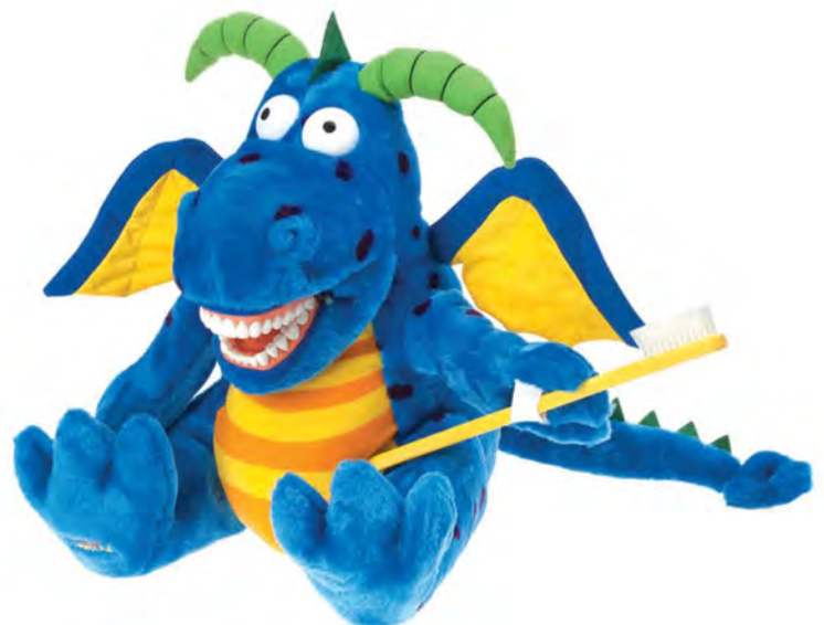
Magi Dragon PDR1100 Smok