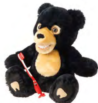
Cubby Bear SB500 Niedźwiedź