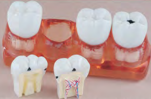
Fig. RV-003 DT.1220.00 Set of 4 teeth with holder / Zestaw 4 zębów ze stojakiem

Zawiera zestaw 4 zębów ze zmianami próchnicznymi