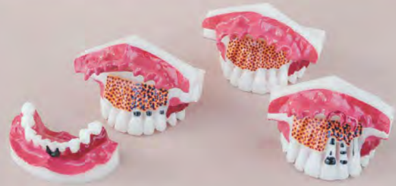
Fig. RV-004 DT.1225.00 Set of 4 models / Zestaw 4 modeli

Zestaw 4 modeli pokazujący rozwój choroby periodontologicznej