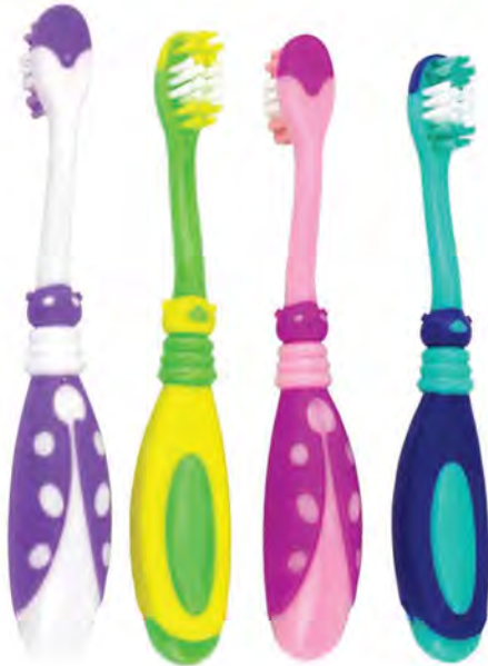
DH.2102.00 Ladybug toothbrush Szczoteczka dla dzieci biedronka