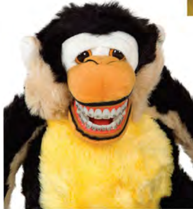
Mojo Monkey ORZ-PC1000 Małpa