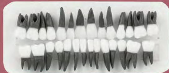
DT.1403.03 Set of 28 teeth with roots / Zestaw 28 zębów z korzeniami Metal teeth / Zęby metalowe