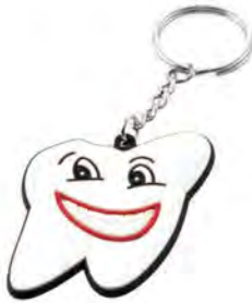
ZP.132.000 Pack of 6 pieces Opak. 6 szt.