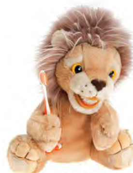
Rasta Lion PPL301 Lew