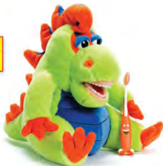
Farley Flossisaurus SF500 Dinozaur