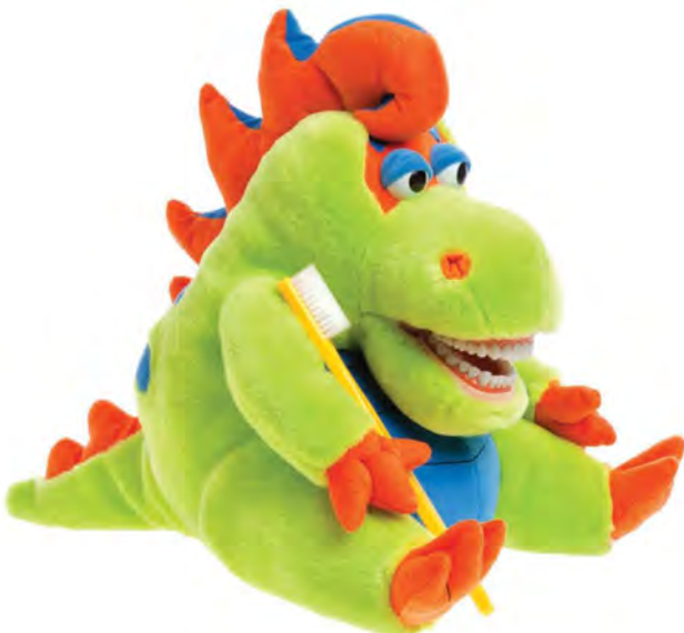
Farley Flossisaurus PF901 Dinozaur