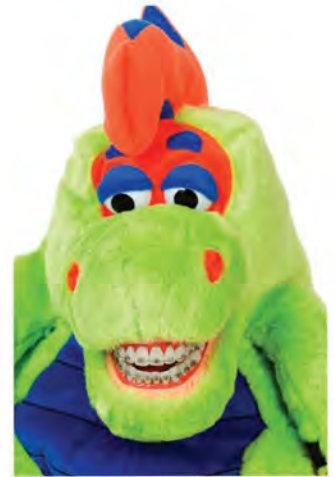
Farley Flossisaurus ORZ-PF901 Dinozaur

Large demonstration models and toothbrush / Modele pokazowe duże i szczotka do zębów