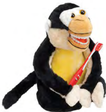
Lil Mojo Monkey PPM300 Małpa