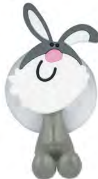
ZP.150.002 Bunny / Królik