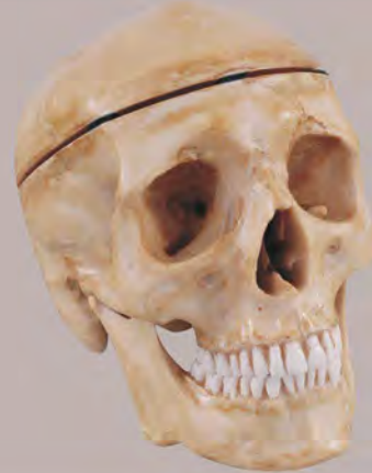
Fig. RC-252 DT.1285.00