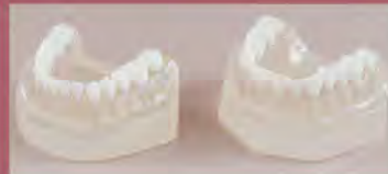
DT.1316.01 Teeth without roots Zęby bez korzeni