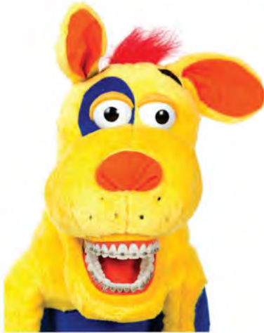
Ollie Z Mutt ORZ-PD700 Pies

Includes 1 large toothbrush Zawierają 1 dużą szczotkę do zębów