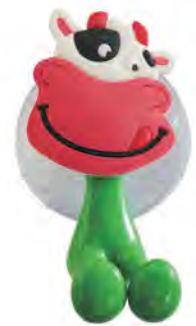
ZP.150.004 Cow / Krowa