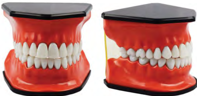
TP100X 75 x 90 x 90 mm

Flossible / Odpowiedni do demonstracji techniki nitkowania