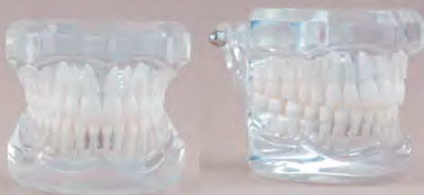
Fig. RE-110 DT.1250.00